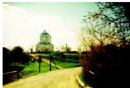
Судак — Новый Свет.

Мазанка — Зуя. День Свт. Николая Чудотворца. 22 мая, вторник