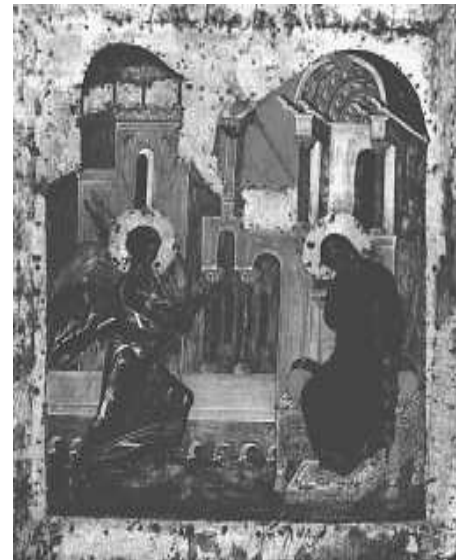
Икона "Благовещение" — Московская школа, начало XV века

Удивительное чудо Благовещения и его бытийный смысл необычайно ярко характеризуют великие слова святителя Гурия (Карпова), архиепископа Таврического и Симферопольского: "Услышав от Архангела, что Господь избирает Ее орудием непостижимой тайны воплощения Бога-Слова, Св. Дева —