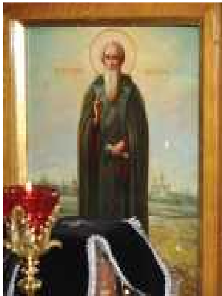
Икона преподобного Лазаря Муромского. Кафедральный Свято-Петропавловский собор г. Симферополя.