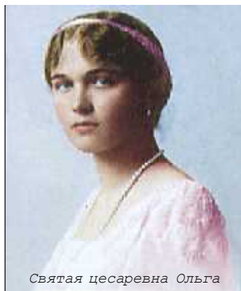
Святая цесаревна Ольга

— Но мы с папой как раз сегодня хотели представить тебя одной очень знатной особе, — расстроилась мама.