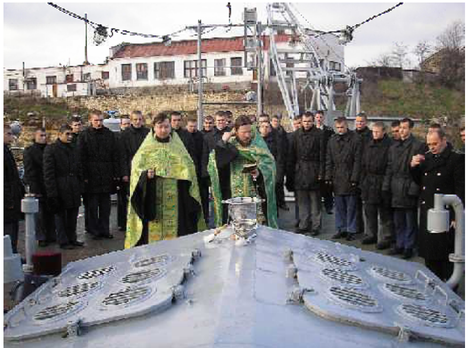
Освящение корабля "Донбасс"

Во время окропления в одной из кают священникам показали корабельную икону Святителя и Чудотворца Николая в киоте и рассказали о том, что с этой иконой произошел, по словам рассказывающих, поисти-