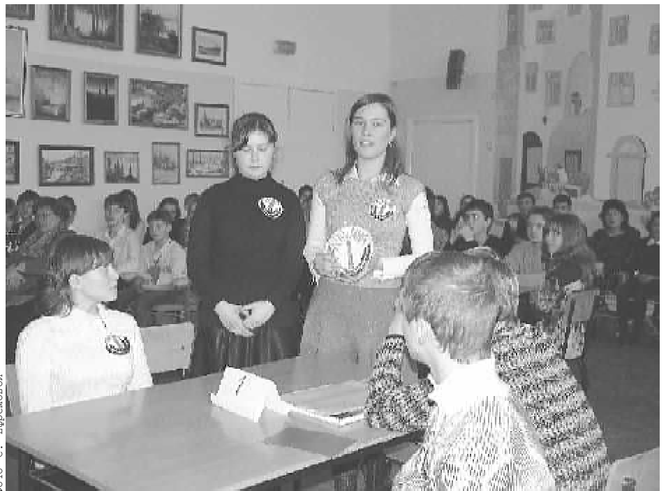
Во время брейн-ринга. Индивидуальный конкурс.

Жюри отметило хороший уровень подготовки школьников по данному предмету. Особо отмечена подготовка и активность общеобразовательных школ №37 и №33, а также лучшее творческое выступление с домашним заданием команды "Тавричане" СШ № 13 г. Симферополя,