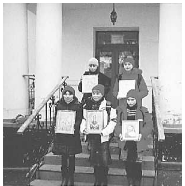
Иконы своей работы — в подарок Лавре

которые оплатили билеты на Президентскую елку и в Софийский собор. А для всей группы были куплены принадлежности и нитки для вышивания.