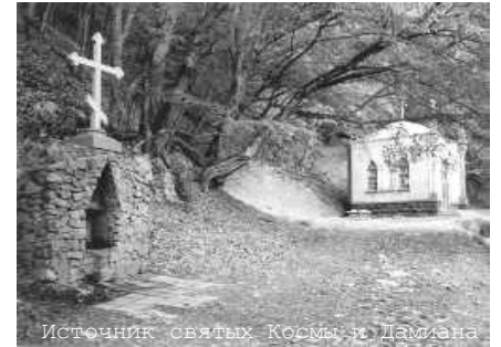
Источник святых Космы и Дамиана

Мангуп — Байдары — Форос. Во время поездки предполагается отдых у моря.