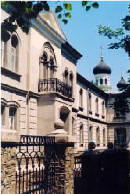
Таврическая духовная семинария

России. Митрополит Вениамин известен не только как выдающийся иерарх Русской Православной Церкви, но и как замечательный писатель.