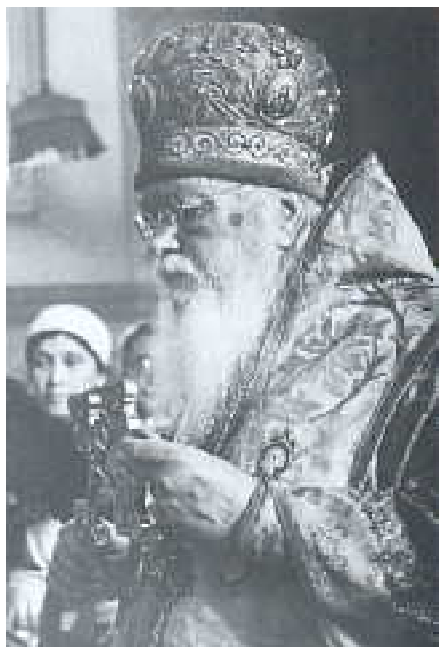
Святитель Лука, 1953 г.

На следующий день старец снова явился в сонном видении. На этот раз он ласково гладил мужа по голо-