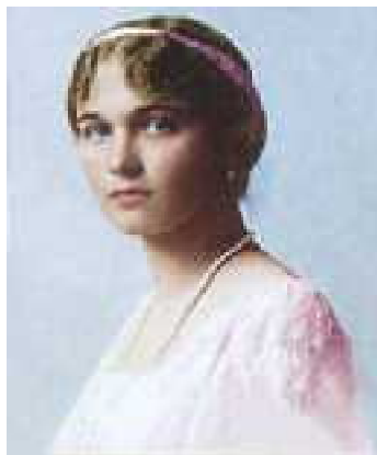
Святая цесаревна Ольга

ки не затратив на это материальных средств.