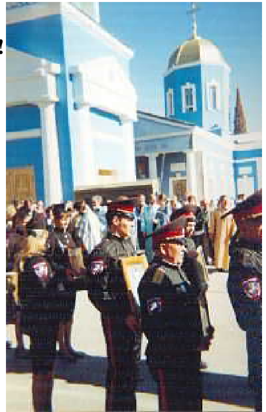
На снимке: перед началом крестного хода по улицам Судака.

В Судак “Таврический благовест” приехал по приглашению и труда-