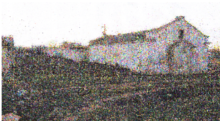
Церковь св. Варвары в с. Оленевка (бывш. Караджи). 2005 г.

Варваринской церкви. Владелец имения эмигрировал вместе с семьей за границу. В 1920 г. о. Гавриил Шапошников общается благочинному протоиерею Иоанну Сербинову о том, что во время богослужений политические власти Крыма ведут учет лошадей, перепись скота, находящегося на личных подворьях, чем отвлекают народ от участия в богослужениях. Но церковная жизнь, несмотря ни на что, продолжается.