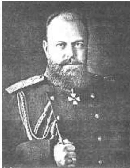
Император Александр III

Государь также ясно понимал значение железнодорожных путей, особенно для такой громадной страны, которой он правил. По его непосредственному указанию были построены