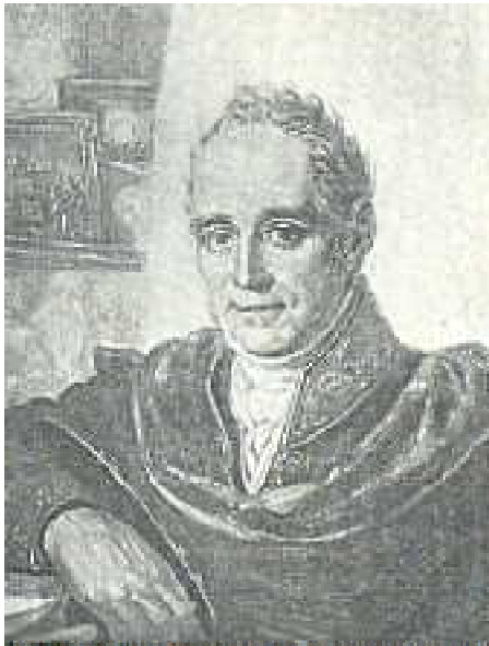
Портрет художника В. Л. Боровиковского работы И.В. Бугаевского- Благодарного

Неблагодарное это дело — давать оценку творчеству живописца признанного. Творчества, вошедшего в историю мирового искусства два века назад и навсегда оставшегося на страницах национальной славы. Однако в последнее время интерес к произведениям многих мастеров прошлого возрос в связи с возрождением церковного искусства. Эти произведения становятся иконными образцами для современных авторов. И, как это часто бывает, имя и мировая известность в большинстве случаев попросту затмевают неприглядную реальность, истинное направление деятельности "мастеров" и "вольных живописцев", их прямое неприятие тех ценностей, утверждению которых должны были бы служить их кисть и их талант. Дерзнем же взглянуть на плоды, оставленные нам в наследство, не торопясь глотать все подряд, разобраться в этом заросшем, одичавшем и заброшенном саду,