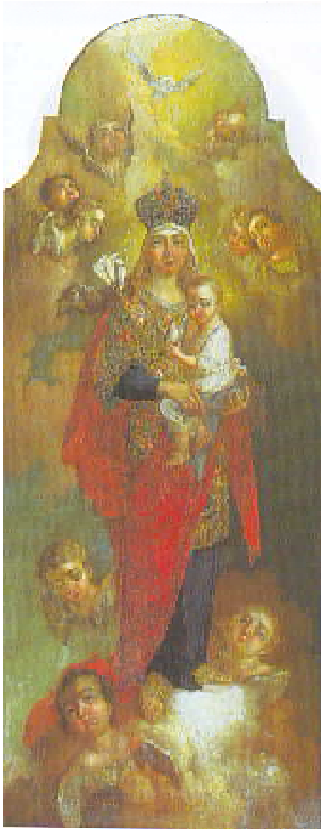
Богоматерь. Икона работы В. Л. Боровиковского. 1787 г.

ста. Это потом найдет свое кощунственное воплощение в печально известном "Евангелии от Льва Толстого", а пока "мастера" трудились, народ восхищался.