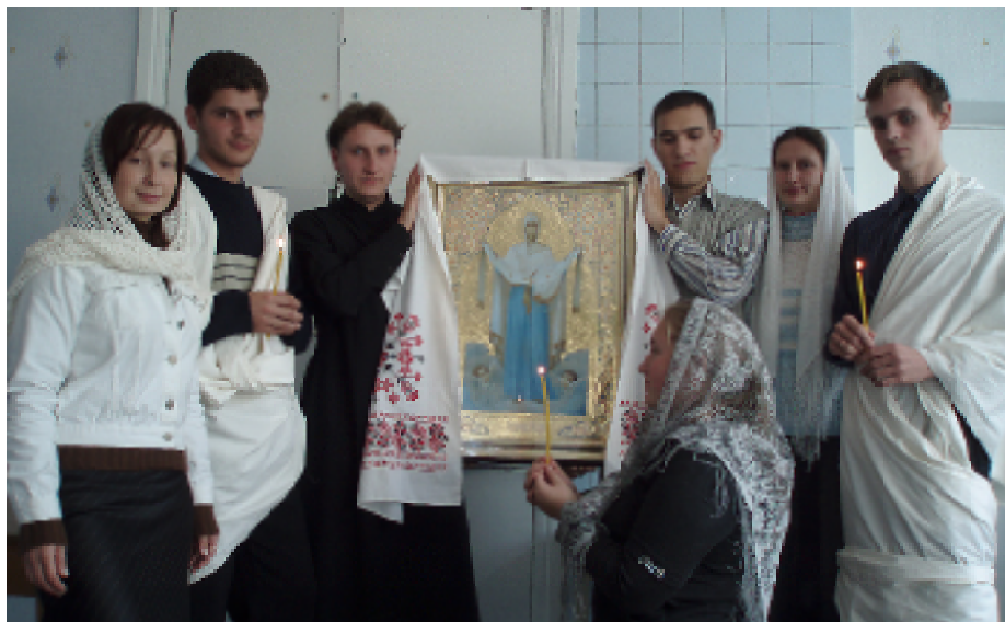
Инсценированный рассказ о празднике Покрова Пресвятой Богородицы