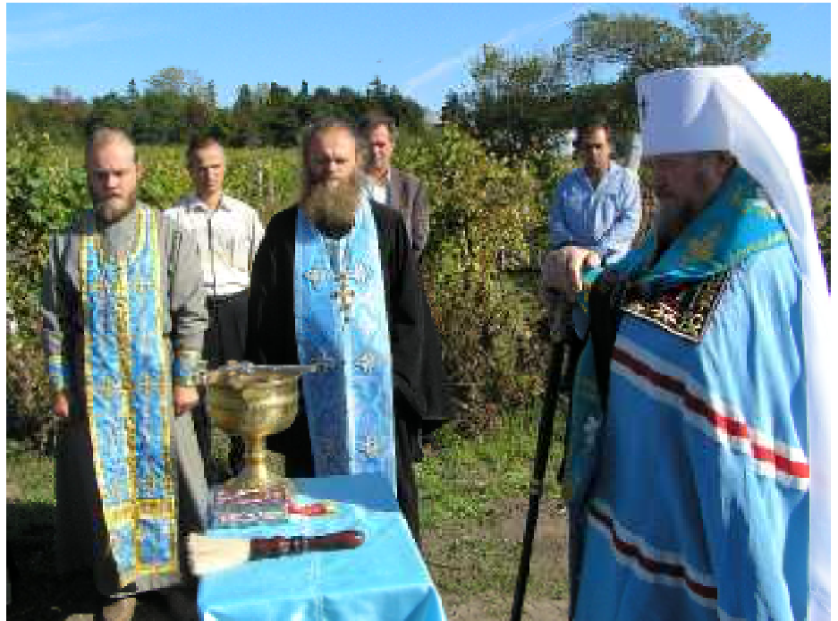
На снимке: во время освящения виноградников